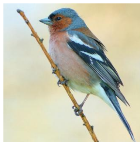
Pinson des arbres

Eh oui ! l'un est mangé et l'autre sera mangé à son tour !!!