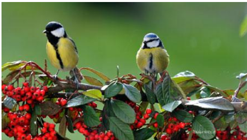
Mésange charbonnière et Mésange bleue

Avec des baies, aux fleurs nectarifères pour les insectes qui seront mangés par les mésanges, le rouge-gorge, le pinson des arbres et autres insectivores ou granivores !